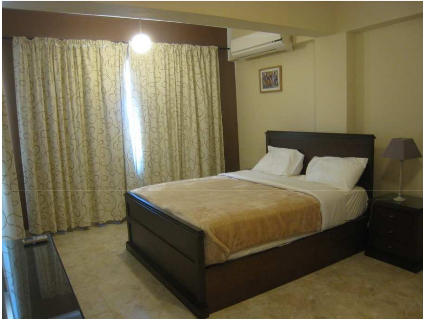
Chambre à grand lit