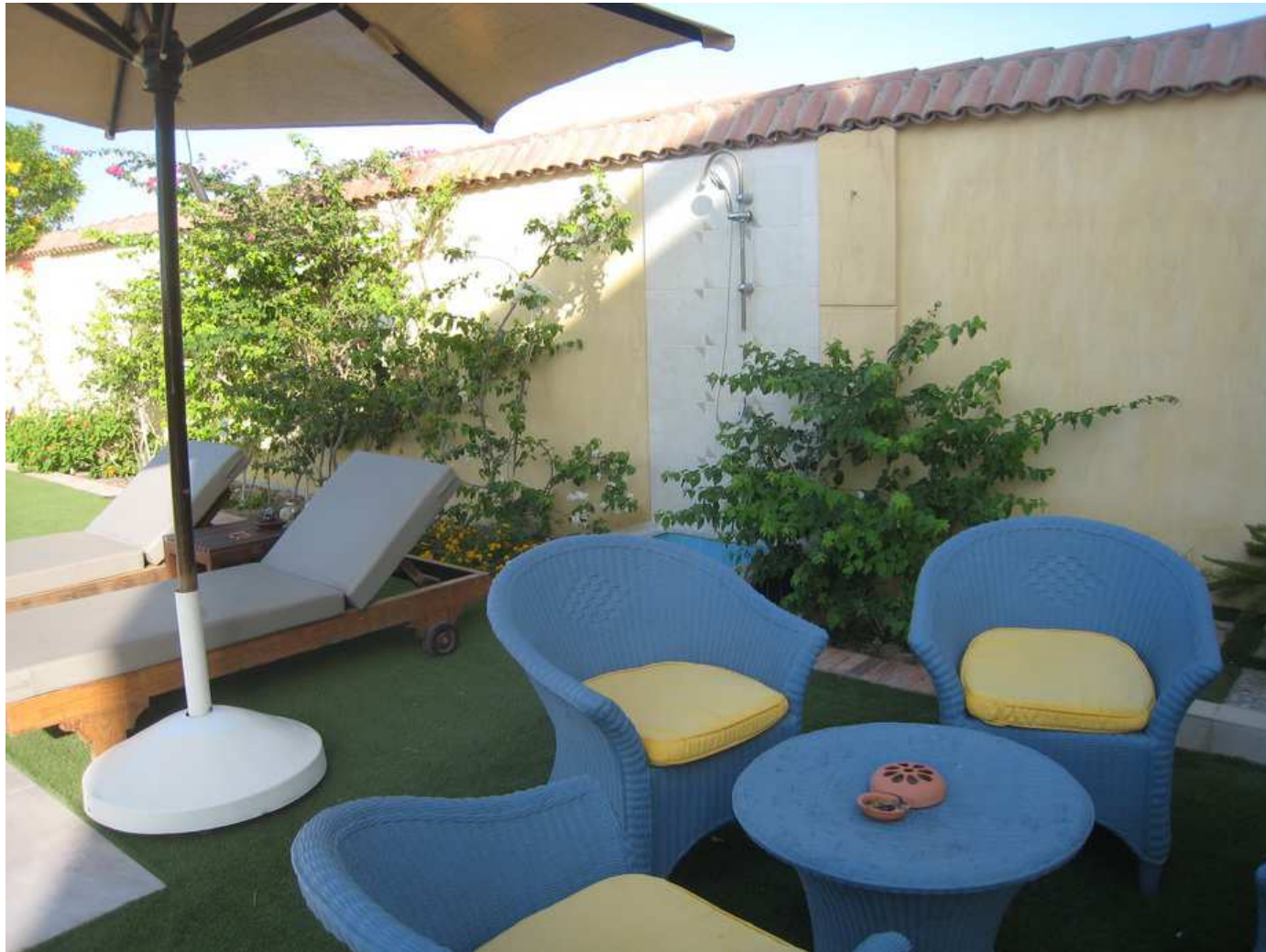
Un espace convivial au bord de la piscine