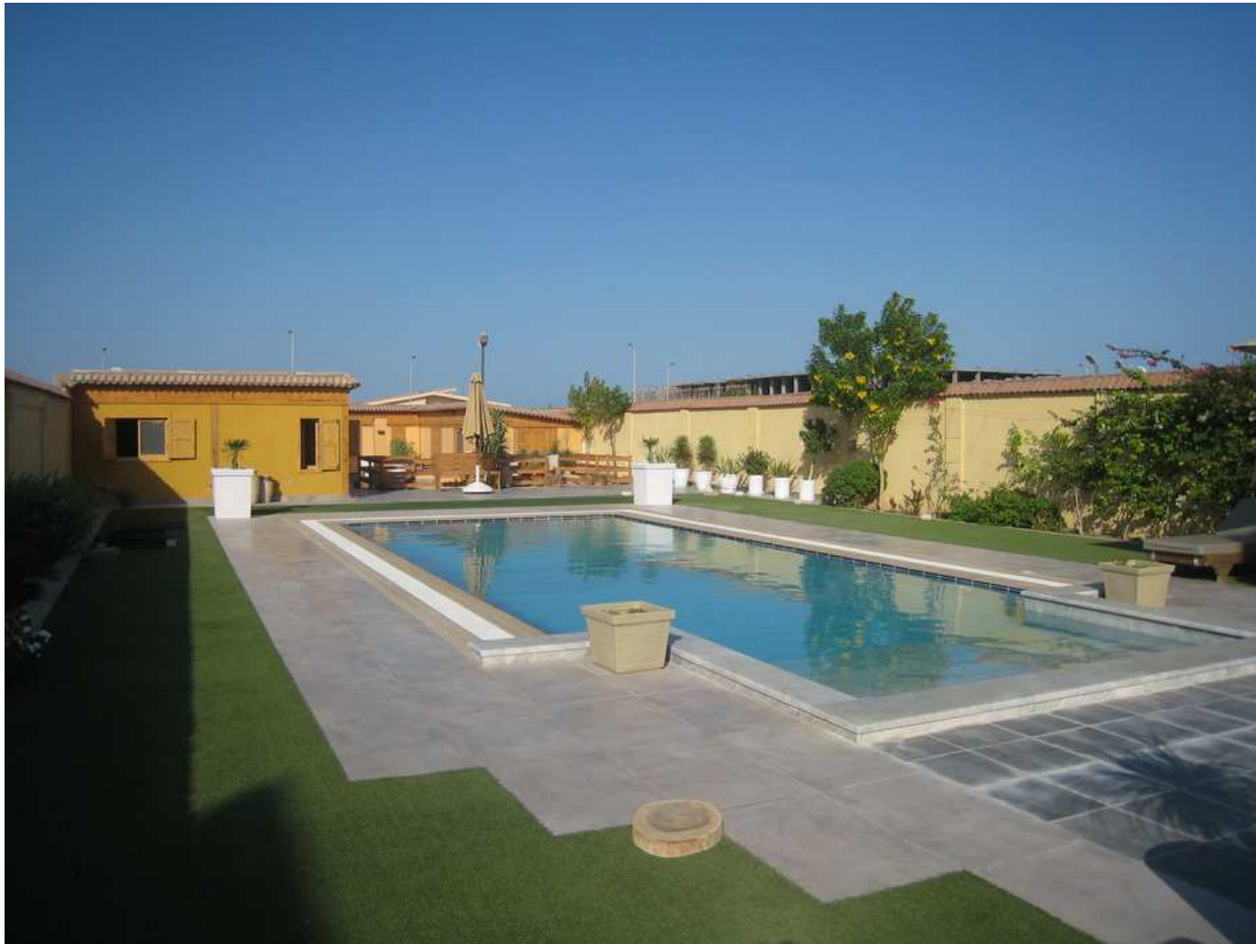
Le jardin, la piscine