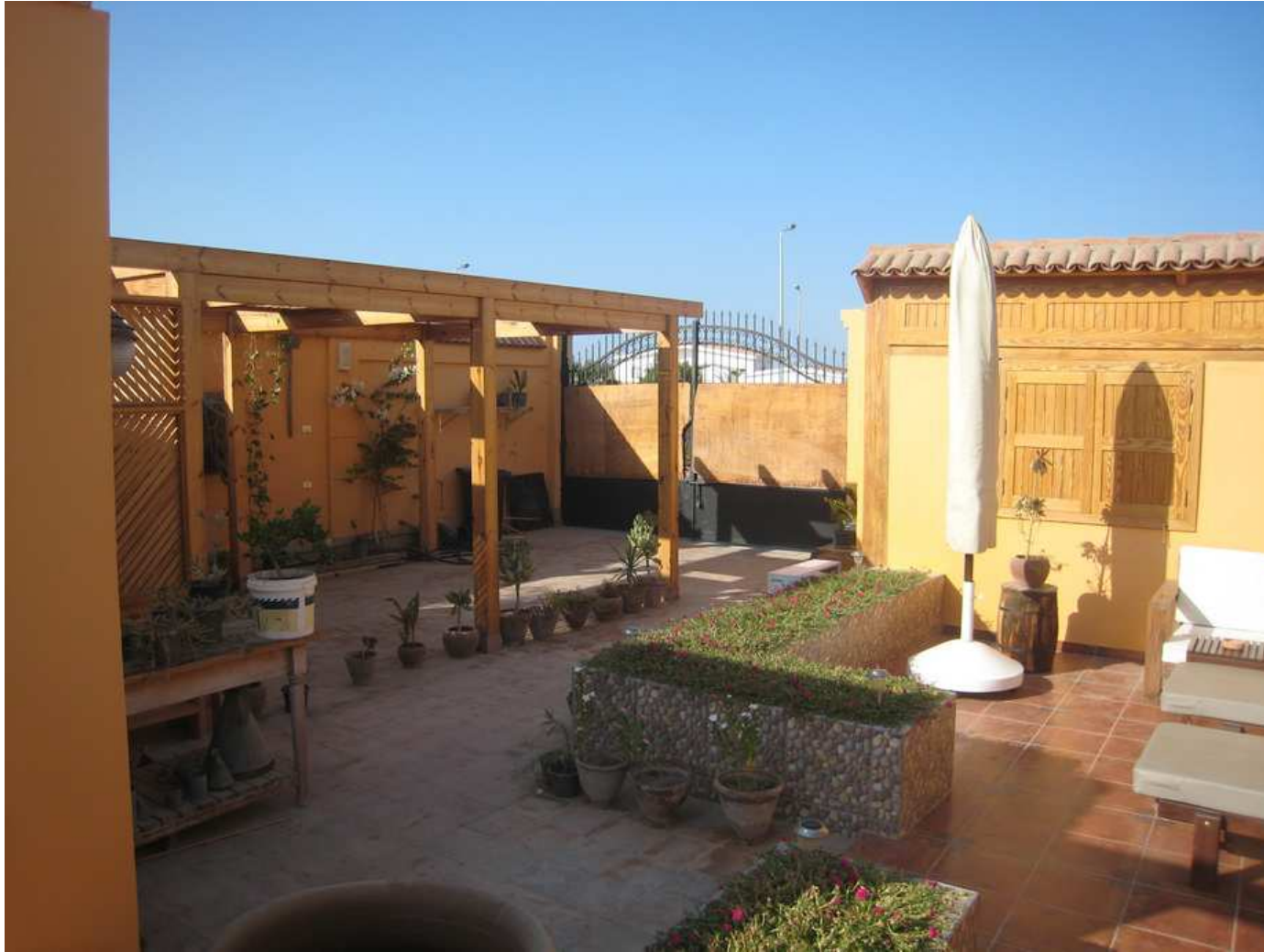
La salle de jeux vue de l'extérieur