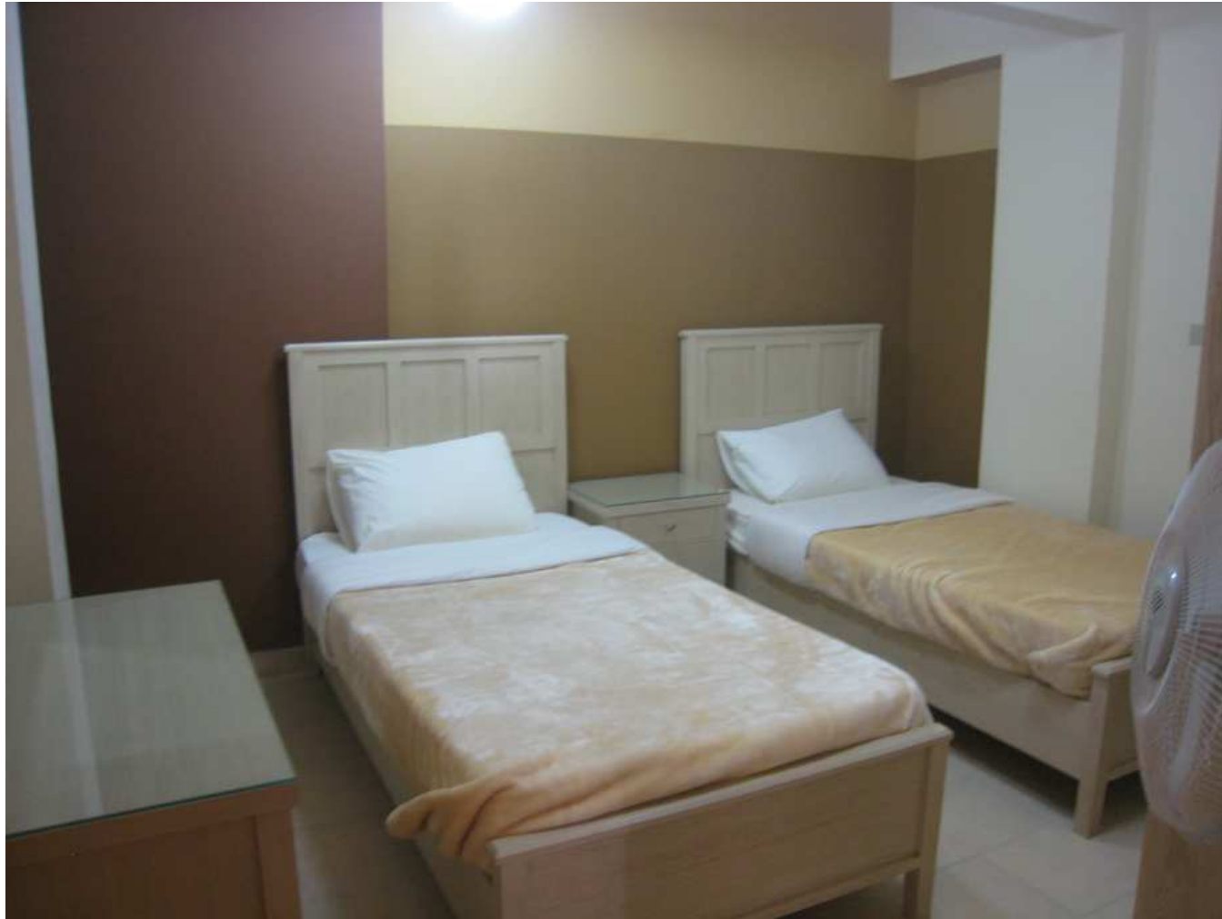
Chambre à 2 lits