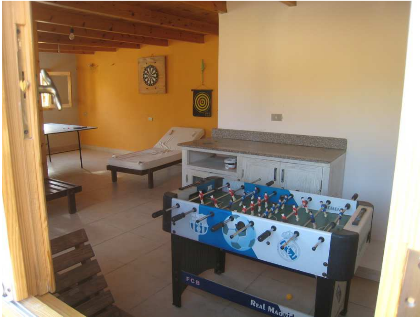
La salle de jeux