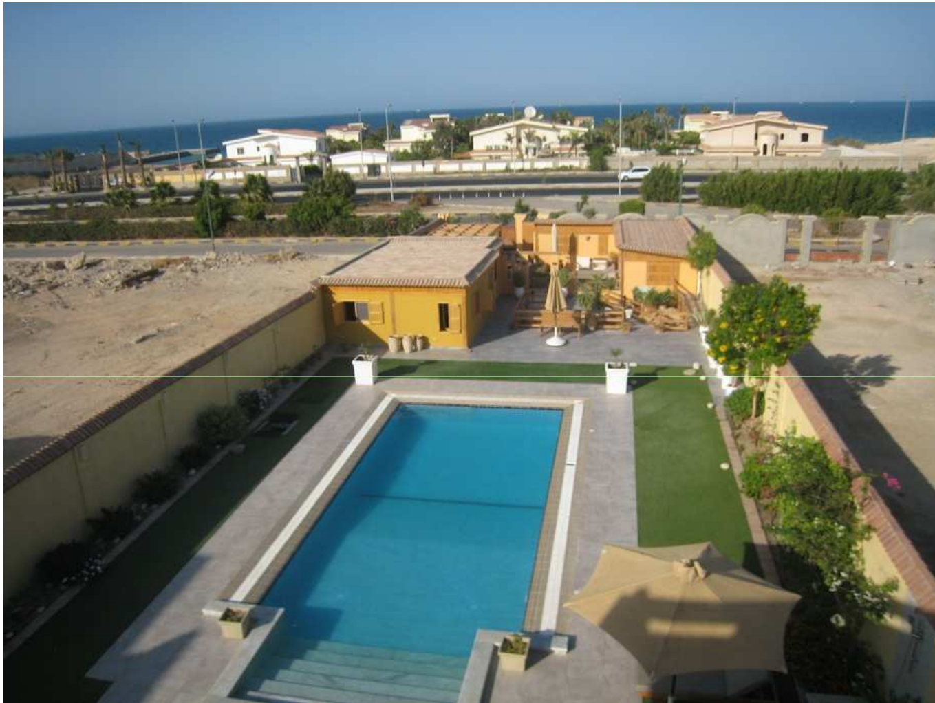
Vue de la terrasse