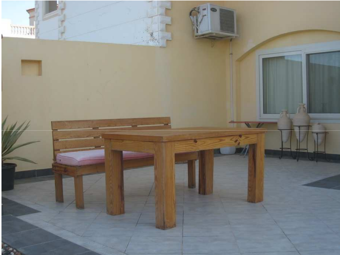
Une autre terrasse