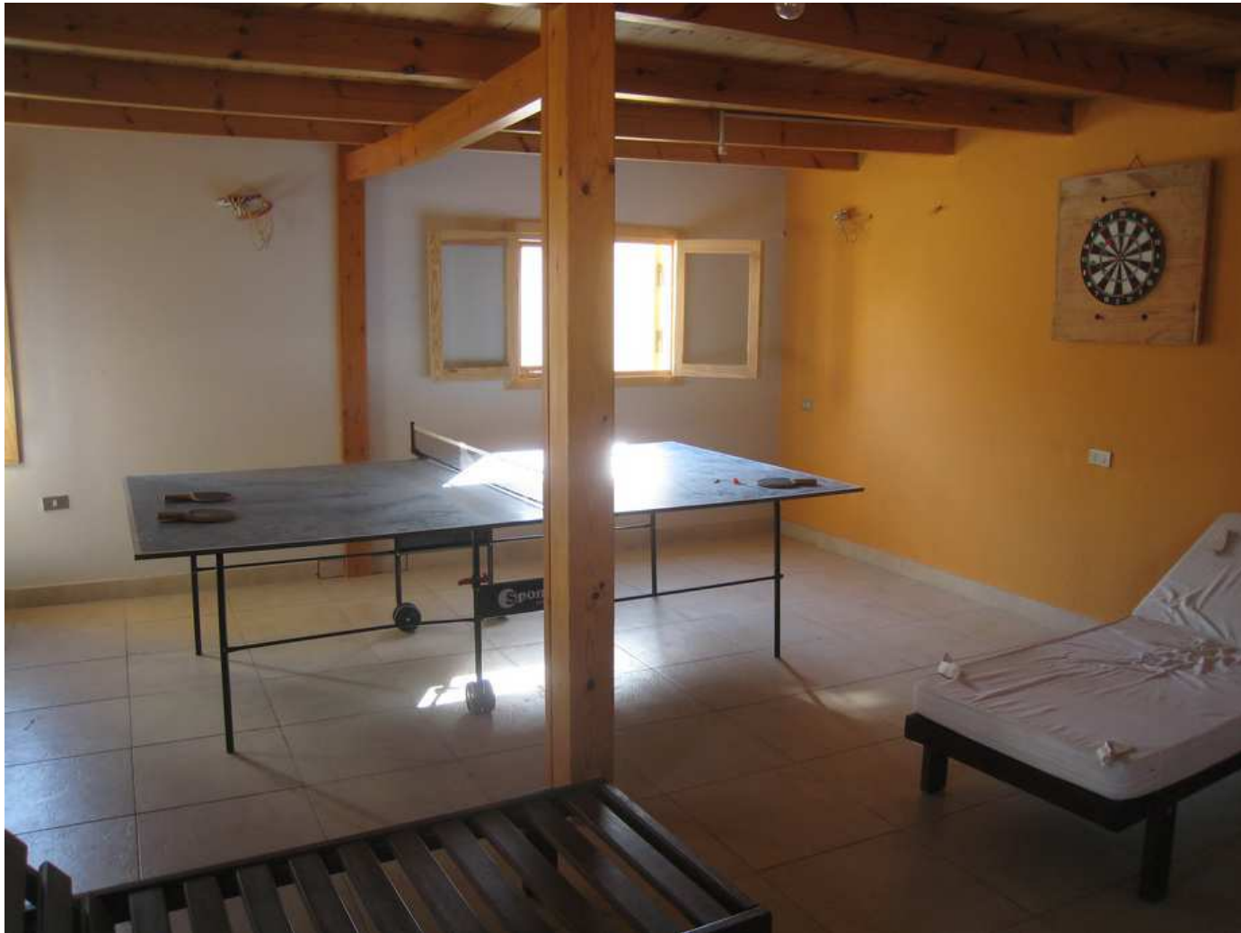
La salle de jeux