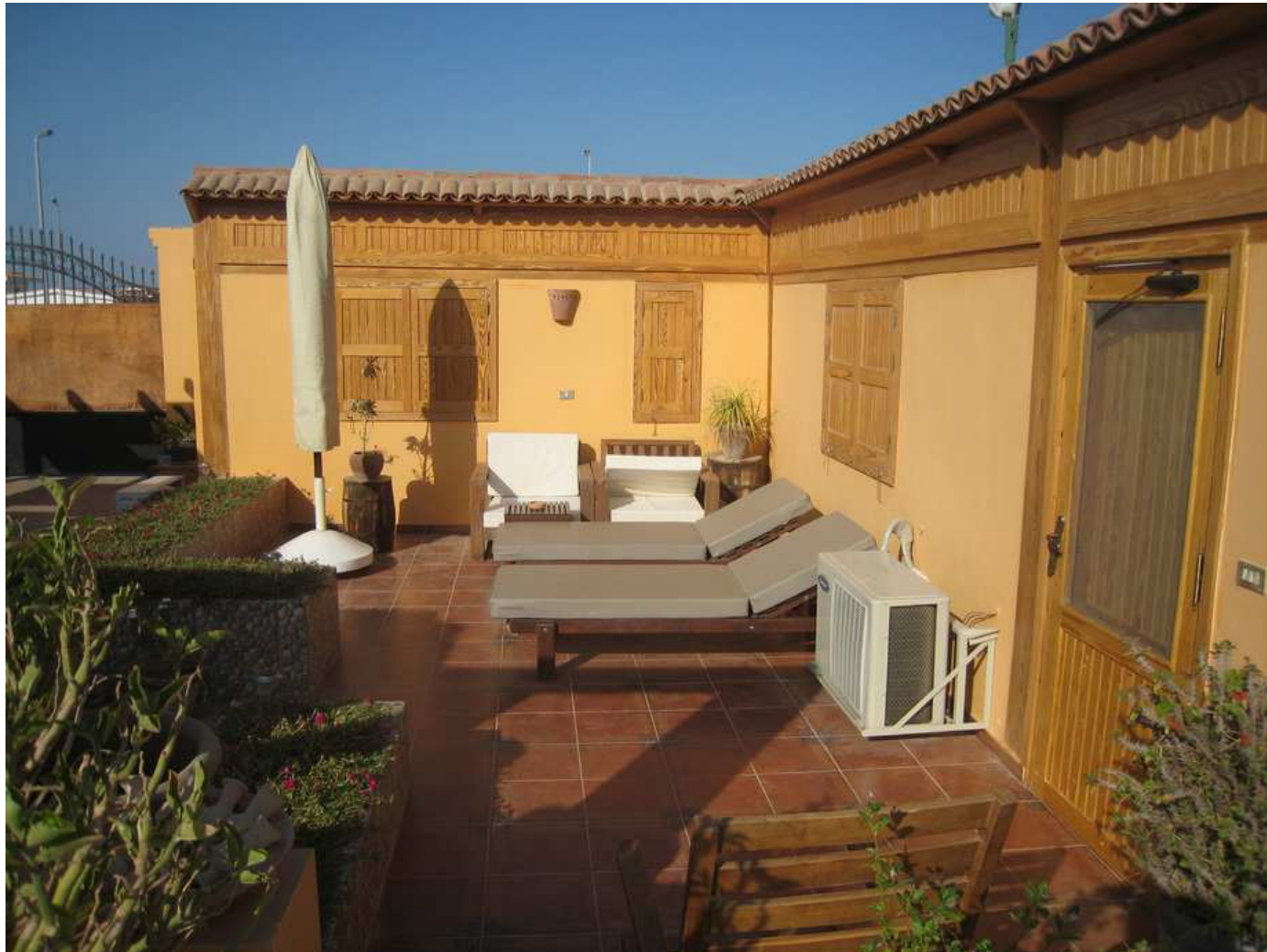
Une autre terrasse