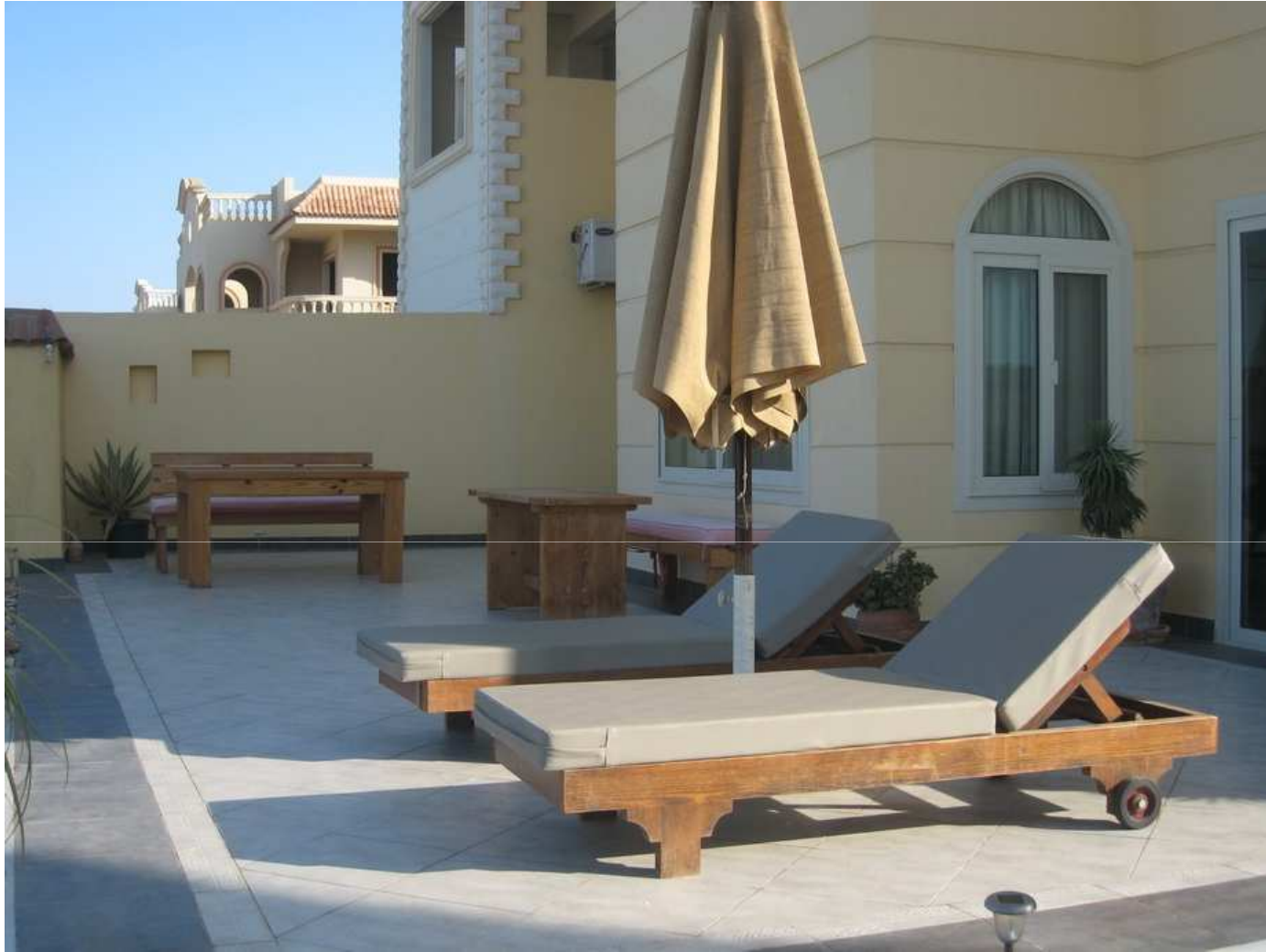
Une des terrasses