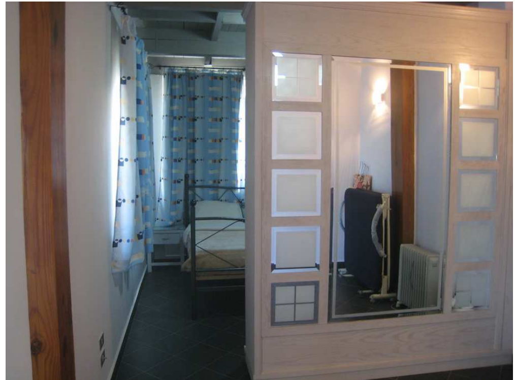
Chambre à grand lit