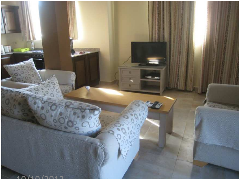
Salon, salle à manger