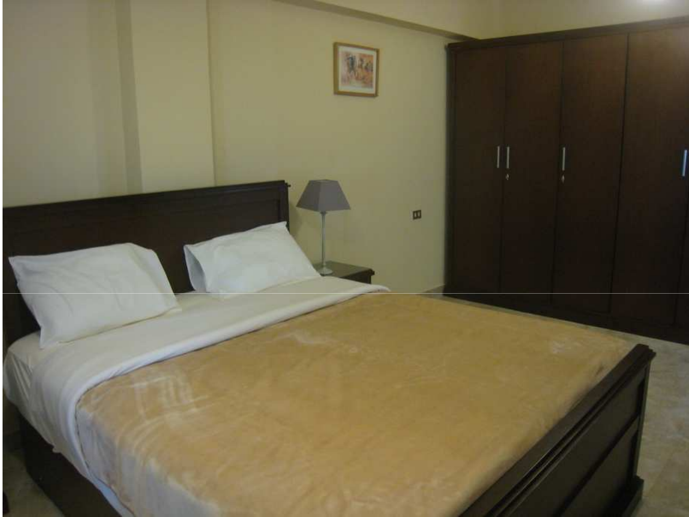
Chambre à grand lit