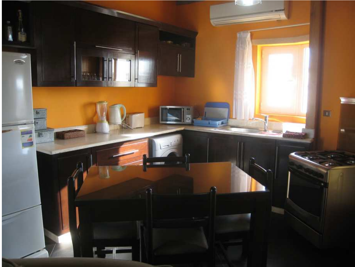
Cuisine américaine et coin repas