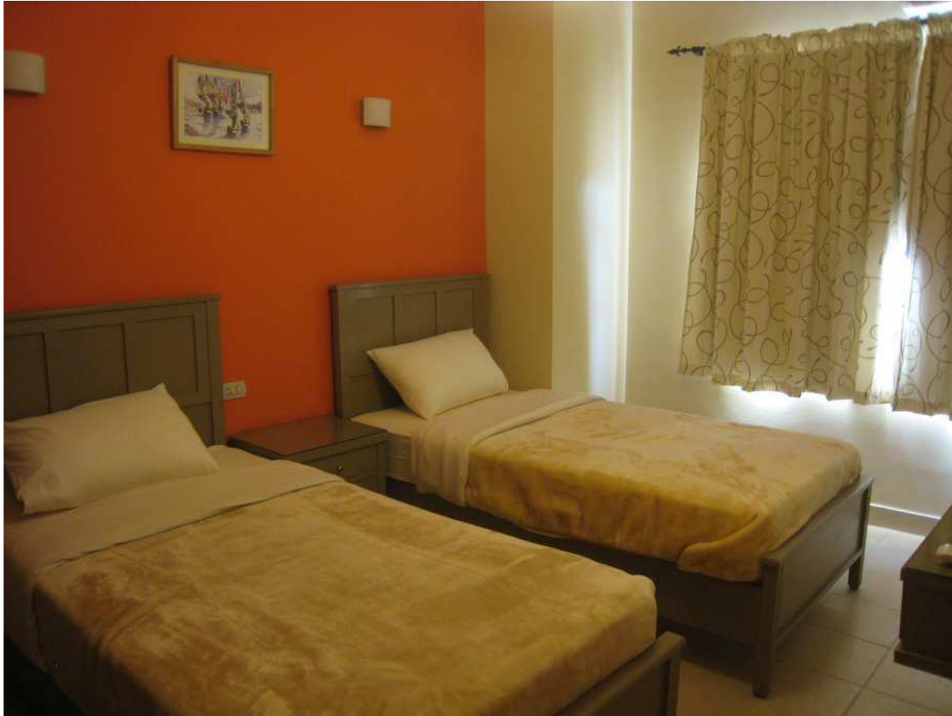
Chambre à 2 lits