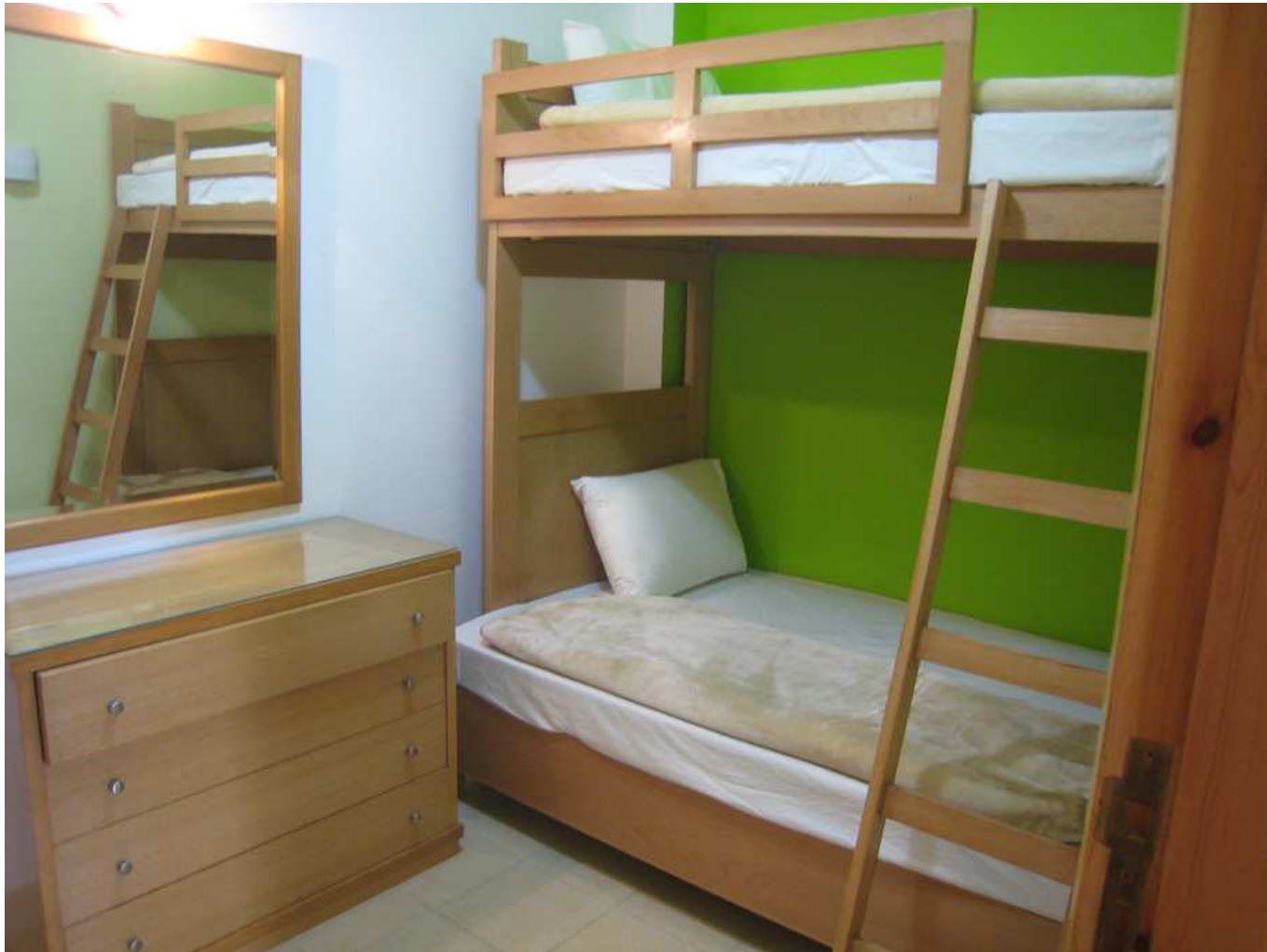
Chambre cabine à 2 lits superposés