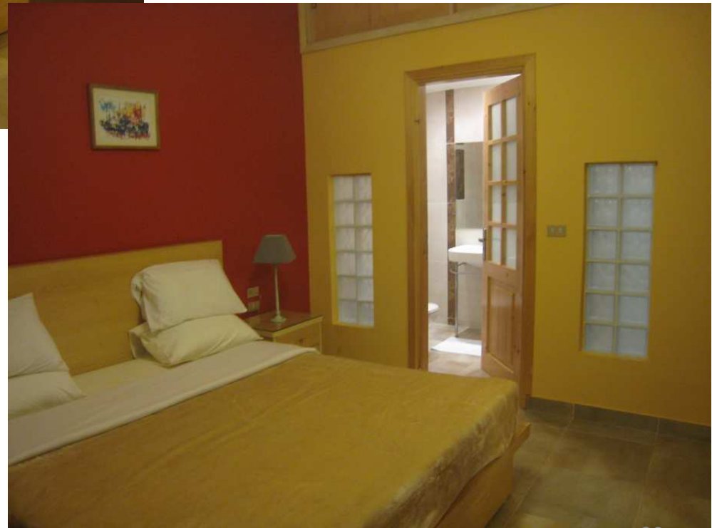
Chambre à grand lit