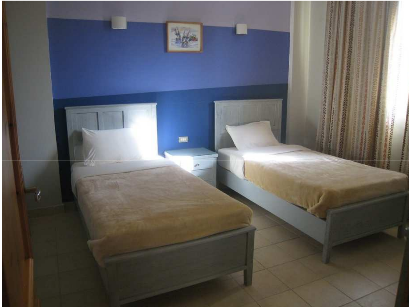
Chambre à 2 lits