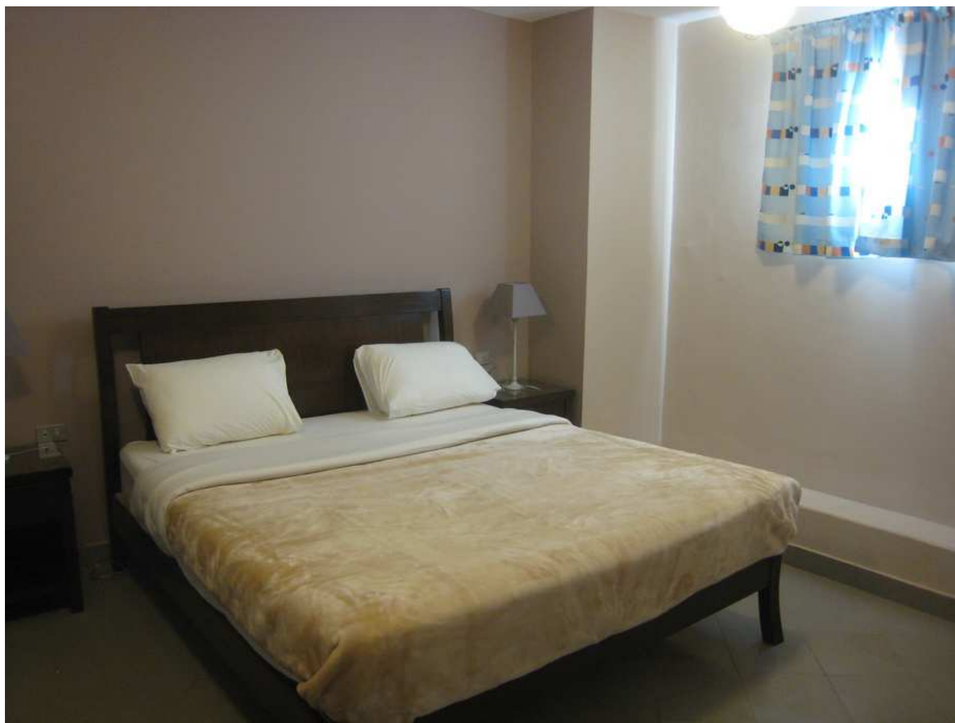
Chambre à grand lit