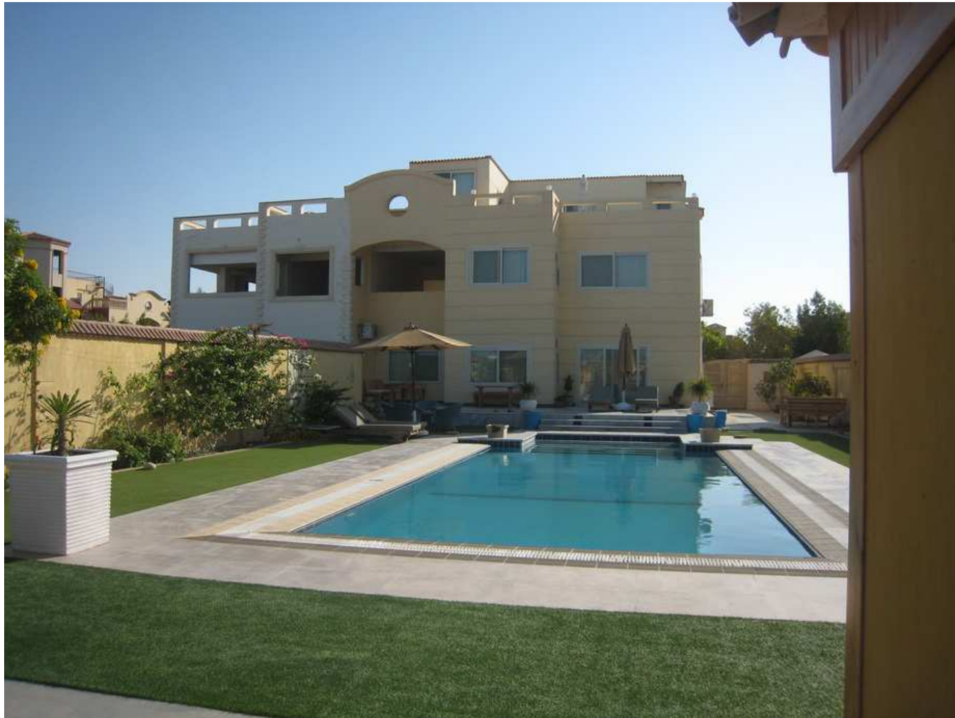
La villa, le jardin, la piscine